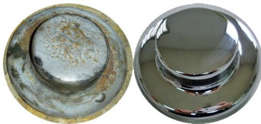
Figura 1: Peça Frontal da Grelha de Mercedes 170 V, antes e depois do tratamento de cromagem

Segundo Araújo (2006), a galvanoplastia refere-se a um processo eletroquímico caracterizado pela deposição de uma camada metálica sobre determinada superfície, com o objetivo de conferir proteção contra a corrosão, melhorar a resistência mecânica ou proporcionar acabamento estético. Esse revestimento se destaca por potencializar o brilho, a resistência ao desgaste e durabilidade dos metais. A cromagem, ou eletrodeposição de cromo, consiste na aplicação de uma camada superficial metálica, como mostra a figura 1, com o objetivo de proteger, isolar ou otimizar as propriedades relacionadas à resistência à corrosão e ao desgaste de peças metálicas, conforme explica Kubiaki (2017).