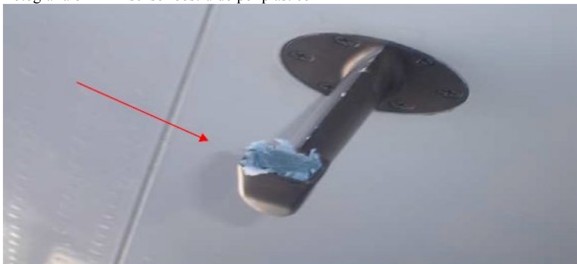
Fotografia 8 - TAT sensor obstruído por plástico

teve seus tubos de pitot (instrumento responsável por fornecer a velocidade da aeronave) e Total Air Temperature (TAT [instrumento responsável por obter a temperatura externa do ar]) obstruídos pelo plástico do banner do balão. Como resultado da obstrução destes componentes, a aeronave apresentou informações falsas em parâmetros essenciais ao voo, perdeu sua capacidade de voar no piloto automático, além de ter sua capacidade de navegação prejudicada. (CENIPA, 2013).