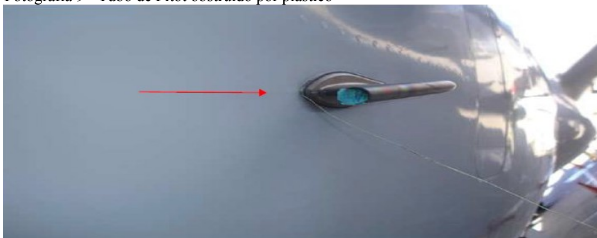
Fotografia 9 - Tubo de Pitot obstruído por plástico

Abaixo, na fotografia 9 podemos observar o tubo de pitot da aeronave obstruído por um pedaço de plástico do balão impactado.