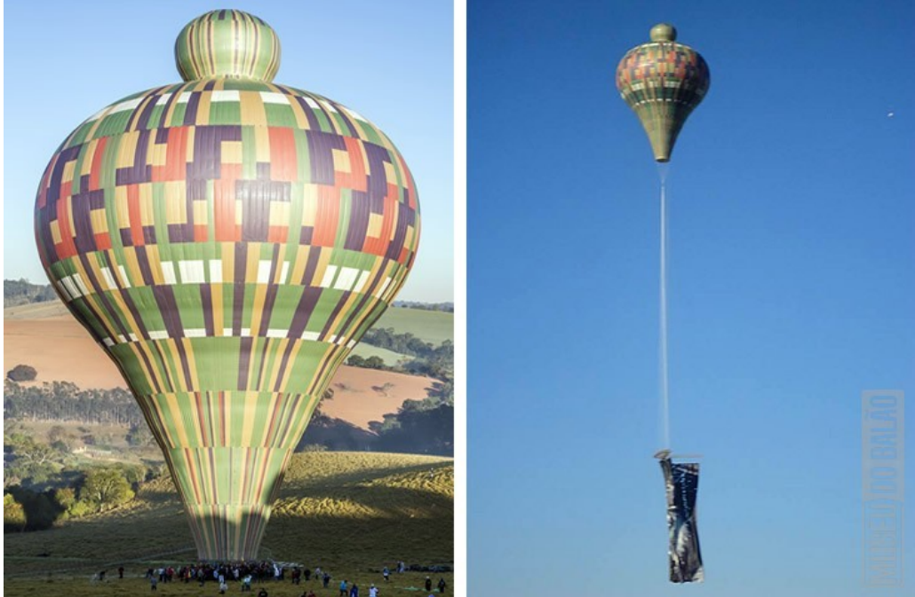
Fotografia 2 - Balão modelo Pião Carrapeta de 105 metros