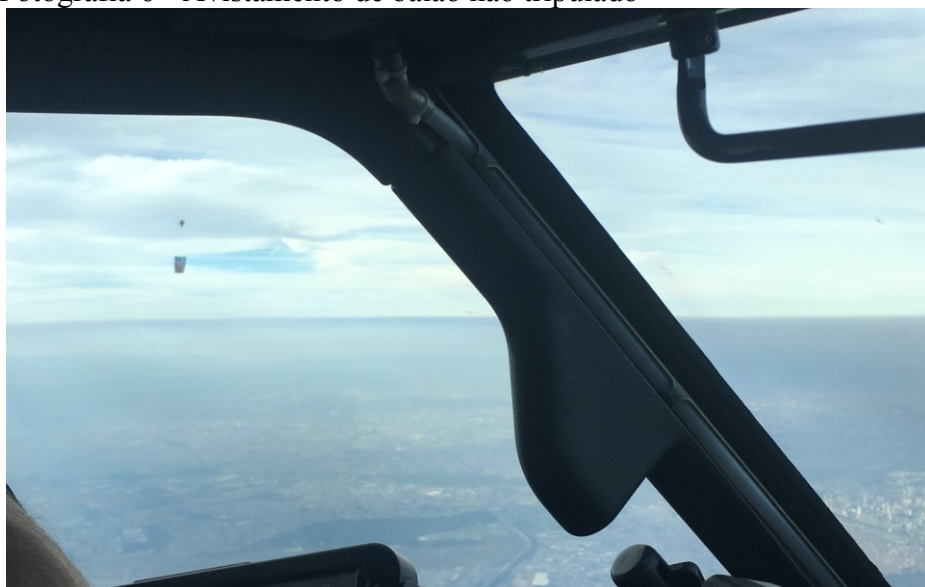
Fotografia 6 - Avistamento de balão não tripulado

A fotografia 6 abaixo, de autoria do próprio autor desde estudo retrata o avistamento de um balão durante aproximação para o aeroporto de Guarulhos em São Paulo.