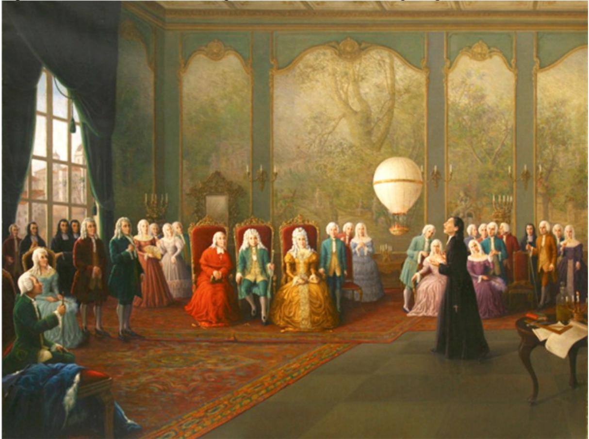
Figura 1 - Bartolomeu de Gusmão apresenta seu invento á corte portuguesa