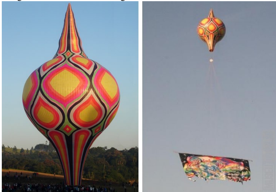
Fotografia 4 - Balão modelo Bagdá de 60 metros

Pião Bagdá: são balões inspirados na arquitetura da cidade de Bagdá, capital do Iraque.