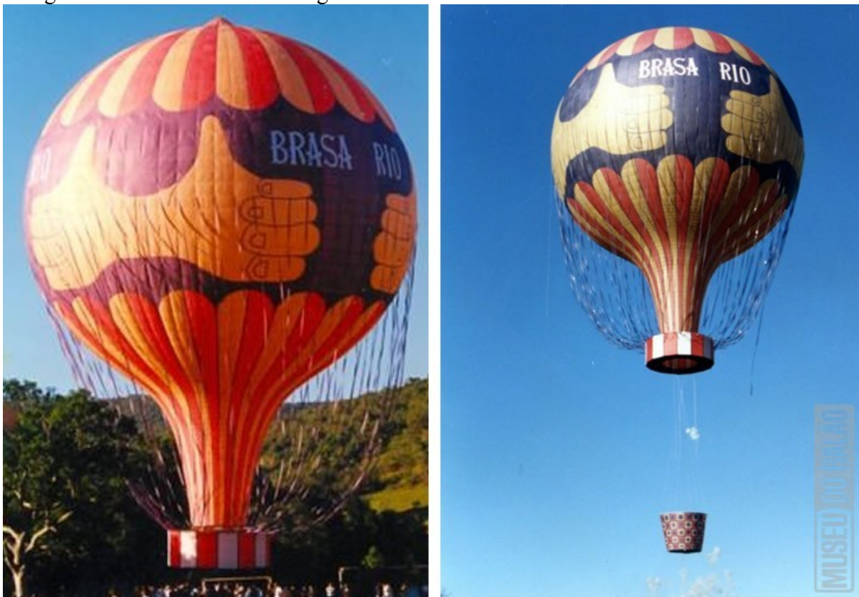
Fotografia 1 - Balão modelo Montgolfier de 43 metros

Montgolfier: inspirados no balão dos irmãos Montgolfier, este balão possui um formato diferenciado, normalmente solto com uma estrutura de isopor preso a sua boca, conhecido como Biscoito. É um balão tradicionalmente diurno, e costuma aparecer com redes, pingentes, cestos ou adereços. (MOLDES DE BALÕES, 2018).