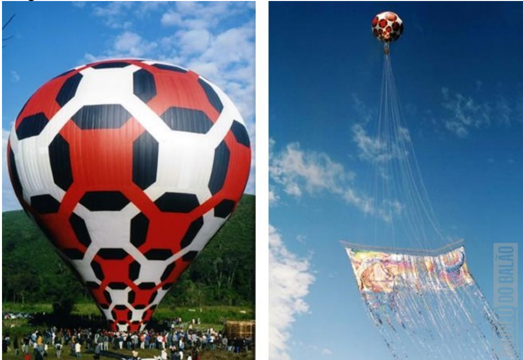
Fotografia 3 - Balão modelo Truffi de 52 metros

Truffi: um modelo muito popular no Brasil com uma grande área interna, conhecido como um balão cargueiro. Recebeu o nome de Truffi em homenagem ao balonista Victorio Truffi, proprietário do famoso balão azul do seriado Turma do Balão Mágico. (MOLDES DE BALÕES, 2018).