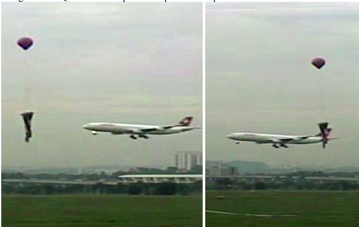
Fotografia 13 - Queda de balão próximo à pista do aeroporto de Guarulhos