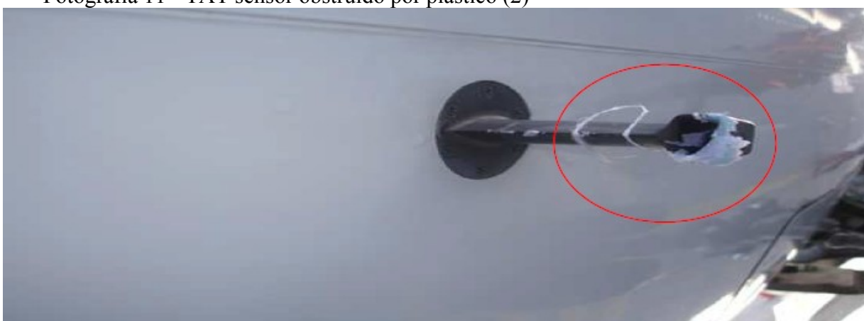
Fotografia 11 - TAT sensor obstruído por plástico (2)

Na próxima imagem, a fotografia 11, podemos observar o sensor de TAT da aeronave obstruído por plástico.