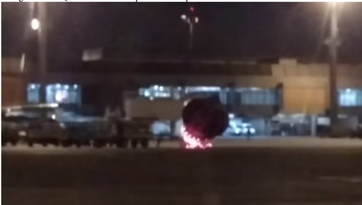
Fotografia 12 - Queda de balão no pátio do aeroporto de Guarulhos

Ainda em 2015, no mês de novembro, um balão de ar quente não tripulado caiu no pátio do aeroporto de Guarulhos, em São Paulo. Segundo um funcionário do aeroporto, foram necessários 5 homens para conseguir apagar o balão, que possuía o tamanho de um carro popular. (JOVEMPAN, 2015).