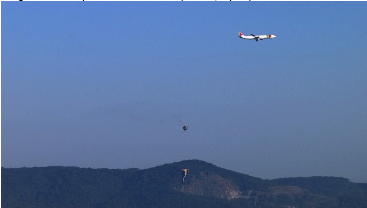
Fotografia 7 - Balão próximo à aeronave em aproximação para pouso

A fotografia 7 abaixo demonstra outro balão próximo a uma aeronave portuguesa em aproximação para o aeroporto de Guarulhos.