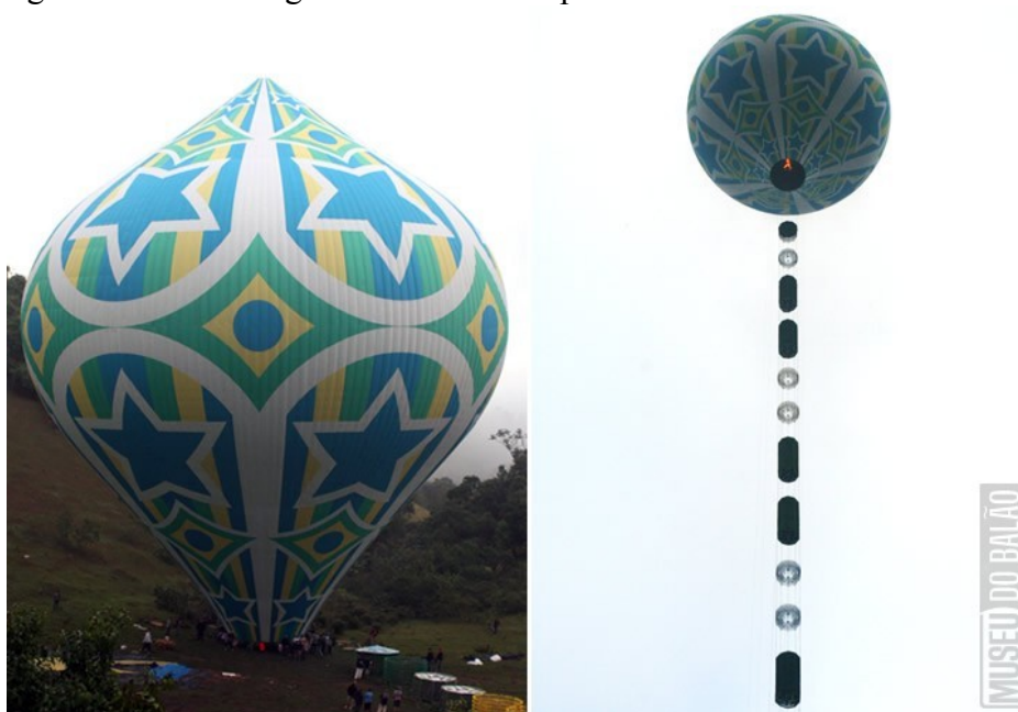
Fotografia 5 - Balão fogueteiro modelo Lapidado de 60 metros

Os primeiros Mixiricas Lapidados apareceram no final dos anos 90 em São Paulo. Com curvas leves e agradáveis, o Lapidado é muito utilizado nos dias de hoje e foi escolhido pelos baloeiros para substituir os Mixiricas, balões de formas clássicas e retas que predominavam nas décadas de 70, 80 e 90.